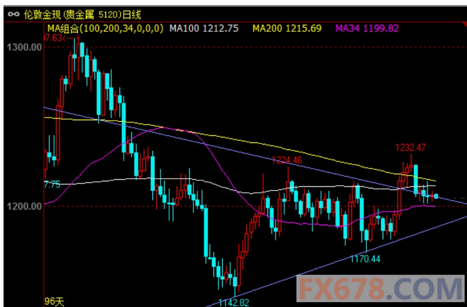
(图 2: 现货黄金日图短期格局一览)

金银市场当前焦点仍在美联储加息信号上,由于美联储第三季度是否加息取决于第二季度经济反弹力度,因而,经济数据继续占山为王。欧洲诸如希腊债务忧虑、西班牙地方选举带来的政治忧虑等,金银均无动于衷。