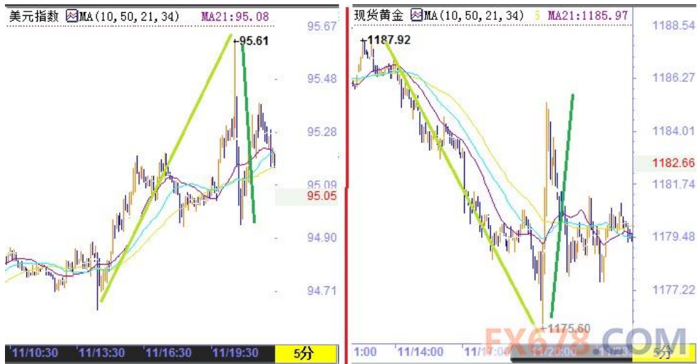
(图 1：解析美元指数、现货黄金对周四 20:30 美国三大数据的市场反应)

周四(6月11日)首先出炉的美国5月零售销售月率增长1.2%创去年3月以来新高，略超预期中值的增长1.1%，虽然不及乐观者所预期的增长1.5%。在今年迄今为止的时间里，美国的消费者一直表现“不给力”，而周四的报告显示，5月消费者们终于回来了，5月零售销售强劲反弹，或表明占经济产出70%左右的美国消费支出重拾动能，进一步支撑经济持续复苏。就业持续增长和燃料价格下跌开始积极影响美国国内消费，带来了今年美国经济增长顺利走出年初低谷的希望。无论是同比还是环比，汽车都是美国零售销售增长的最大动力。